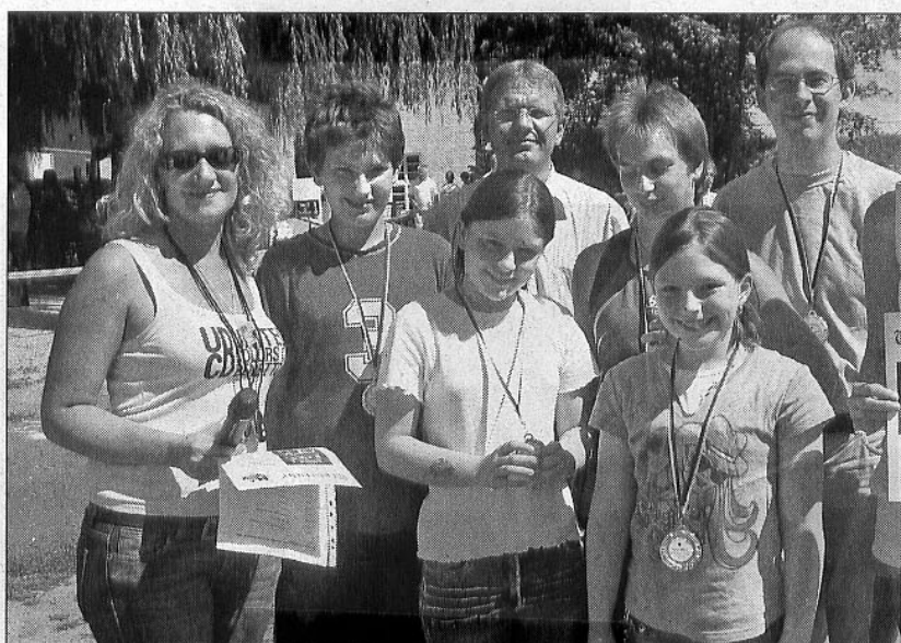
Die Kolpingfamilie St. Emmeram konnte punkten. Sie wurde Zweite.