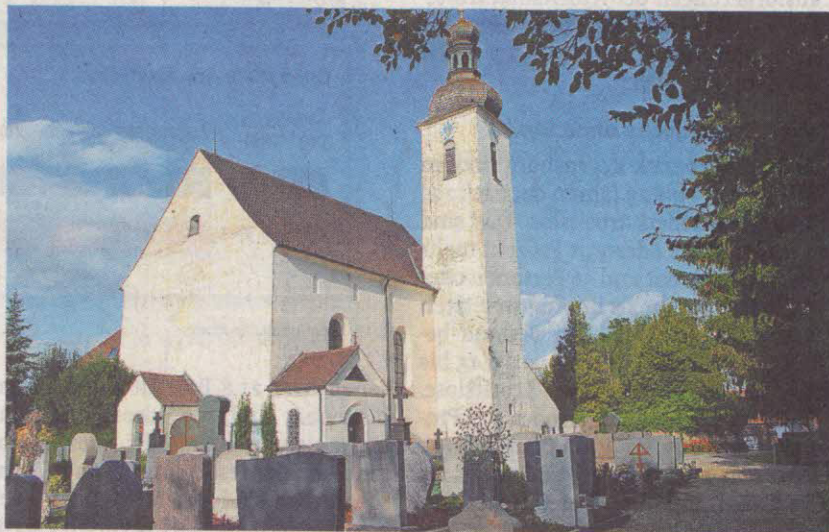
St. Michael wartet auf den „Orgelschnuppertag“.

Nun, Letzteres kann der Diakon definitiv ausschließen und wird das