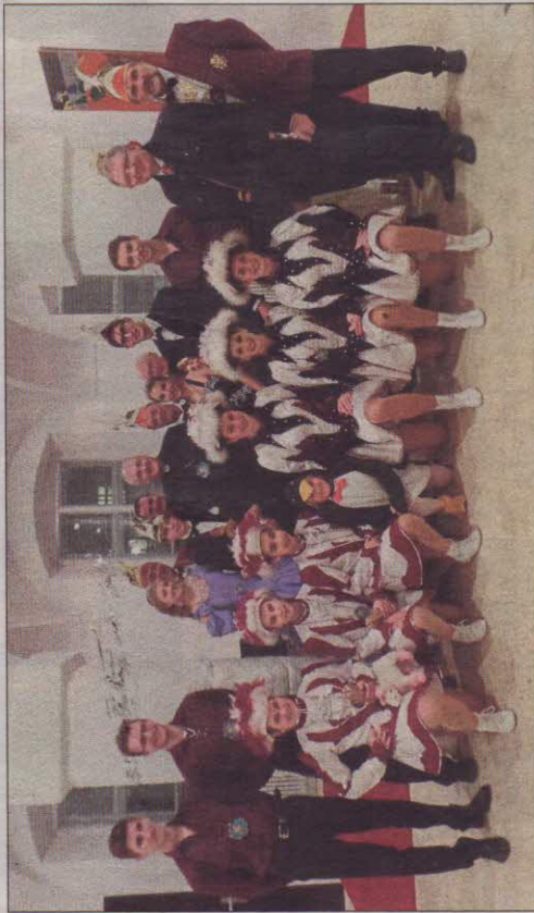
Bischof Rudolf Voderholzer inmitten der Faschingsgesellschaft.

Bischof Voderholzer war vom schwungvollen Tanz der Garden sehr angetan und spendete einen kräftigen Applaus. Der Höhepunkt des Treffens war die Übergabe des Ordens durch Ihre Lieblichkeit