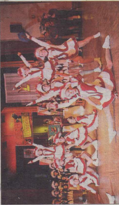
Die Kindergarde heizte die Stimmung beim Inthronisationsball im Kolpingssaal tüchtig an.

Der Inthronisationsball vermittelte einen ersten Eindruck über das Programm, welches die Garden und