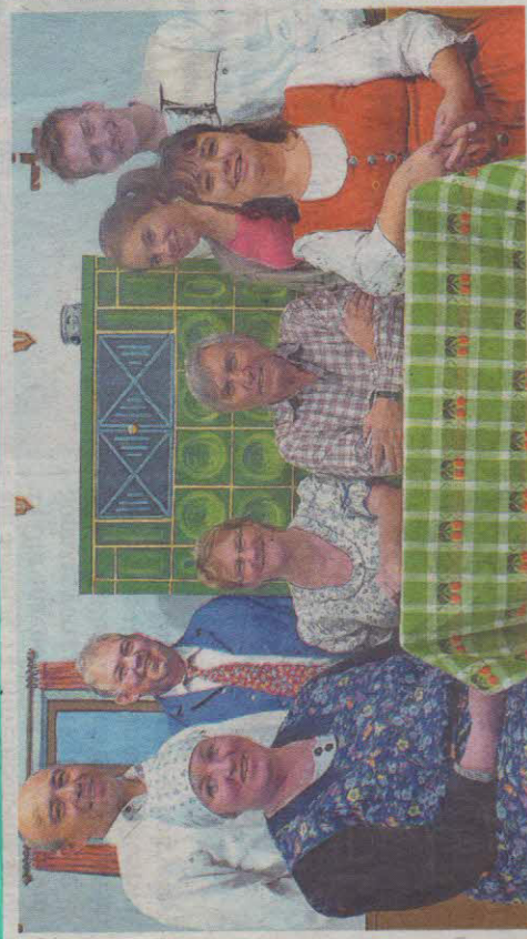
Die Kolpingfamilie St. Emmeram spielt wieder Theater.

bedankte sich Bischof Voderholzer mit je einem Schoko Nikolaus zum Auftakt der Adventszeit bei den Narren. Bischof Rudolf Voderholzer segnete alle Aktiven und das Wirken im Geiste des seligen Gesellenvaters Adolph Kolping.