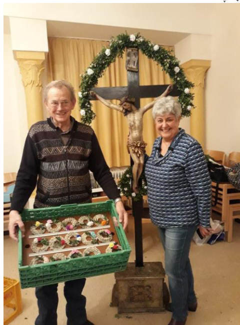
„Am Kreuz kommt keiner vorbei.“ (Seliger Pater Rupert Maier)

Wir wünschen allen eine gute Gesundheit, Gottes Segen und alles Gute.