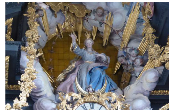
Heilige Maria – bitt für uns!