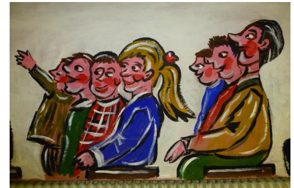
(Fasching 2015, Gemälde von Werner Steib)

Froh zu sein, bedarf es wenig und wer froh ist, ist ein König.