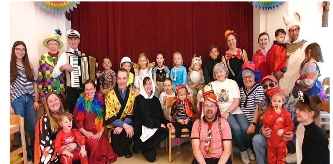
Foto vom Kinderfasching 2024

----- Fastenzeit, Besinnung, Orientierung...