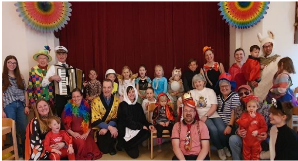
Rückblick, Kinderfasching 2023

Dienstag, 04.03. 19:00 Kehraus der FG Lusticania beim Prössl-Bräu in Adlersberg (Reser- vierungen erbeten - 09404/1822)