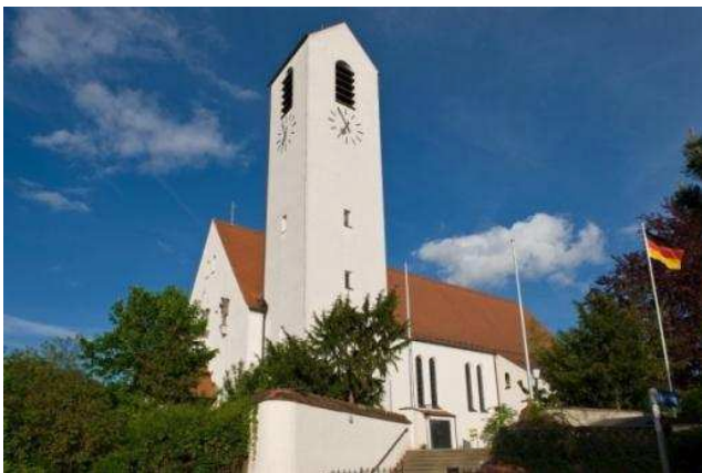
Mariä Himmelfahrt Sinzing

Wir laden wieder sehr herzlich ein, an unserer schon zur "guten Tradition" gewordenen Radwallfahrt teilzunehmen. Es wäre schön, wenn wir in Frauenberg auch wieder Autowallfahrer begrüßen könnten.