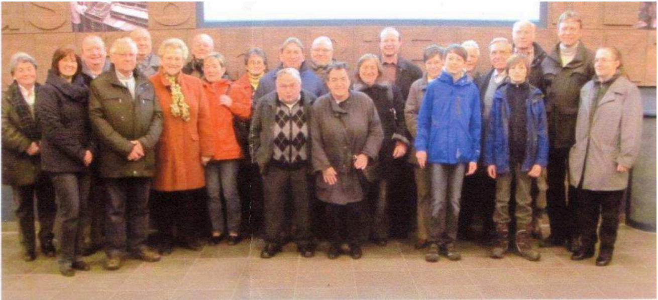
Zu Besuch im Druckzentrum der Mittelbayerischen Zeitung