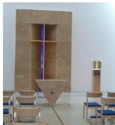
Kapelle Haus Werdenfels