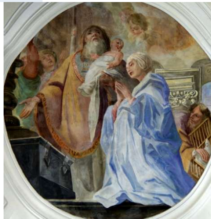
Cosmas Damian Asam: Maria übergibt Simeon das Jesuskind, rechts Joseph mit den Tauben, 1719/1720, in der Basilika des Klosters in Weingarten

Das Fest der Darstellung des Herrn wird vierzig Tage nach Weihnachten als Abschluss der weihnachtlichen Feste gefeiert. Der früher gebräuchliche Name Mariä Purificatio, Reinigung, erinnert an den jüdischen Brauch, auf den sich das Fest bezieht: Nach den Vorschriften des Alten Testaments galt die Mutter vierzig Tage nach der Geburt eines Sohnes als unrein. Die Frau musste ein Reinigungsopfer darbringen, normalerweise ein einjähriges Lamm, eine Felsen- und eine Turteltaube; für Arme genügten zwei Felsen- und zwei Turteltauben (3. Mose